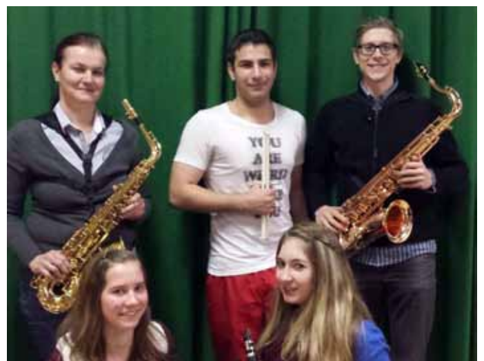
Die Neuzugänge 2013/2014