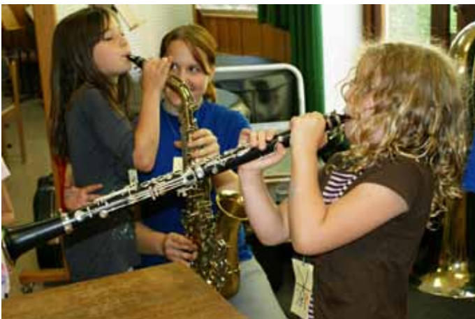
Die Freude am Musizieren ist deutlich zu sehen!

Wie jedes Jahr in der zweiten Juliwoche gibt es in Bezug auf den Ferienpass einen Workshop bei uns im Musikerheim und im Schlosshof. Ein abwechslungsreicher Stationenbetrieb, der von kompetenten Musikerinnen und Musikern betreut wird, sorgt für einen kreativen, musikalischen und aktiven Nachmittag. Die Kinder haben dabei die Möglichkeit Instrumente auszuprobieren, eigene anzufertigen und bei lustigen Aktivitäten, wie zum Beispiel Dossenschießen und Sackhüpfen, mitzumachen. Eine gemeinsame Probe mit der Jugendkapelle und die abschließende Urkundenvergabe runden den Musikworkshop gemütlich ab. Auch dieses Jahr würde sich die Blasmusik Königstetten über eine zahlreiche Teilnahme sehr freuen, um den Kindern den Spaß und die Freude an der Musik zu vermitteln.