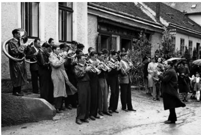
Der erste Auftritt: Fronleichnam 1954

Ein wesentlicher Bestandteil des Vereinslebens der Blasmusik ist der Kirtag. Nachdem lange Jahre der Kirtag in Königstetten nicht mehr gefeiert worden war wagte sich die Blasmusik an die Ausführung dieser Veranstaltung im Jahr 1972 heran. Als Termin wurde das letzte Wochenende im Juli, der sogenannte „Jakobi-Kirtag“ – also der Gedenktag des heiligen Jakob, des Patrons der Königstetter Pfarrkirche – ausgewählt. Sowohl das Datum als auch der Erfolg dieser Veranstaltung haben sich bis heute gehalten.