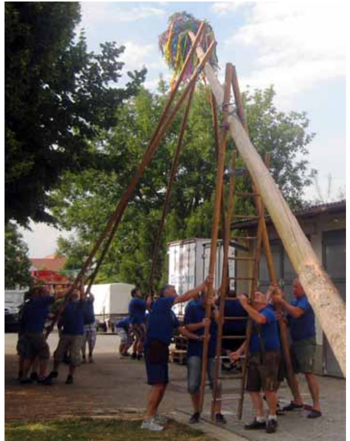
Der Mai- und Kirtagbaum werden traditionell händisch aufgestellt.

Ende Juli ist's wieder so weit. Der Königstetter Schlosshof wird von 25.–27. Juli zum 42. Schlosshofkirtag in ein Festgelände verwandelt, das keine Wünsche offen lässt. Neben den gewohnten Leckerbissen werden freitags nach dem traditionellen Kirtagbaum-Aufstellen wieder das beliebte Spanferkel und sonntags der altbewährte Schweinsbraten aufgetischt. Damit dann auch die Verdauung im Rhythmus bleibt, werden Samstag- und Sonntagabend der „Kingstown Express“ und Sonntag zum Frühschoppen die „Bunka Buam“ den Takt angeben. Der Sonntagnachmittag wird wie schon in den vergangenen Jahren vom stilistisch bunt gemischten Musikantenstammtisch umrahmt. Um musikalisch auch der Jugend und allen Junggebliebenen gerecht zu werden, wird's Freitagabend beim Schlosskeller Clubbing mit Beats von „Deejay Pheedell“ und kühlen Drinks heiß hergehen. Wenn's das Wetter dieses Jahr wieder gut mit uns meint, steht einem dicht gepackten und abwechslungsreichen Festprogramm also nichts mehr im Weg. Die Blasmusik Königstetten freut sich schon jetzt auf drei beschwingt-heitere Tage mit Ihnen!