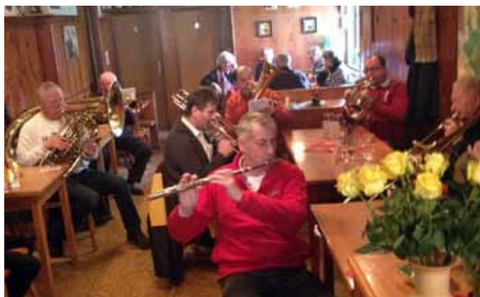
Zu Gast in Hainbuch

Unverändert ist seit damals die positive Aufnahme durch die Bevölkerung: In vielen Häusern werden wir schon freudig erwartet und unser Ständchen mit einer Spende oder Stärkung belohnt. Für diese großzügige Unterstützung möchten wir uns bei allen Freunden und Gönnern sehr herzlich bedanken!