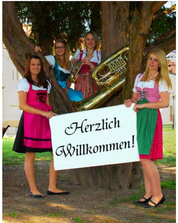
Die Königstetter Musikerinnen freuen sich auf Ihren Besuch!