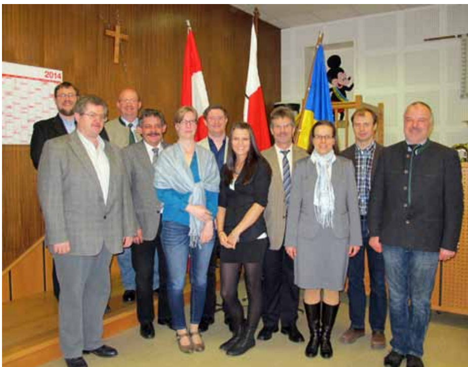
Der Vorstand mit Bgm. Roland Nagl

Das laufende Jahr steht unter dem Motto „60 Jahre Blasmusik Königstetten“. Zusätzlich zu den jährlich stattfindenden Veranstaltungen - Konzert, Maifest und Schlosshofkirtag - feiern wir unser Jubiläum mit dem Bezirksmusikfest im September, dem Großen Zapfenstreich anlässlich der Jungbürgerfeier im Oktober und einem Kirchenkonzert im Dezember, der Kammermusikwettbewerb im März läutete das Jubiläumsjahr musikalisch ein.